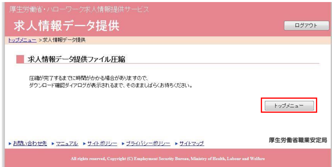
表 2.1.3 求人情報データ提供ファイル圧縮画面の各部の説明