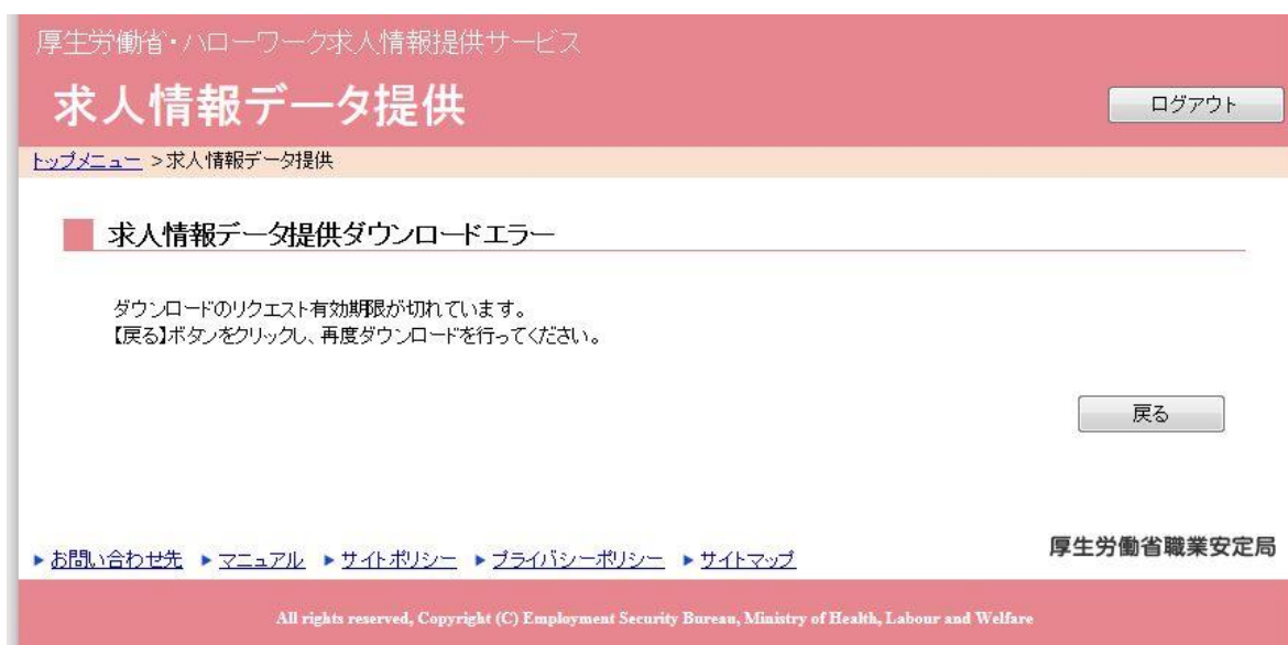
表 2.1.4 求人情報データ提供ダウンロードエラー画面の各部の説明